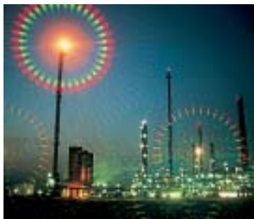
Filtre spectral B+W