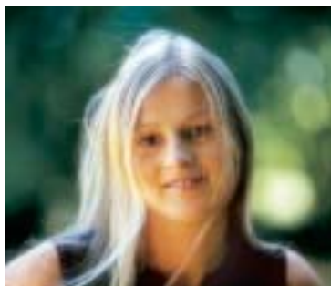
Filtre diffuseur B+W

Tous les filtres de trucage B+W sont proposés avec des variantes produisant des effets différenciés. Tout particulièrement en ce qui concerne les portraits, l'effet de flou artistique choisi peut s'avérer très important. L'offre va de l'effet à peine perceptible jusqu'à la nébulosité caractérisée avec des lumières accentuées. On peut trouver ainsi pour chaque sujet, le filtre correspondant à son choix personnel. Il est évidemment possible de combiner entre eux différents filtres de trucage et de découvrir des effets surprenants.