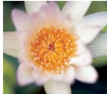
avec bonnette NL4

et, comme les filtres, elles sont petites et légères. Elles font office de lentilles convergentes, qui réduisent la distance focale, à tirage optique égal, tout en augmentant l'échelle de reproduction. Elles permettent ainsi d'obtenir facilement en plein format des fleurs, des insectes, des pièces de monnaie ou des timbres.