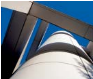
avec filtre polarisant

ne peut être reconstituée avec l'ordinateur. Les filtres Digital Pro ont un diamètre de monture et un design spécialement accordés aux appareils numériques et aux caméscopes. Les nouvelles montures chromées sont en totale harmonie avec les tendances claires des appareils numériques.