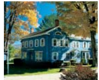
avec filtre polarisant

saturées. Pour la photographie en nature ou de paysage, le filtre polarisant apporte un ciel d'un bleu intense, des nuages d'un blanc resplendissant et des plantes aux couleurs vives. Il est également idéal pour les prises de vues avec des plans d'eau. Leurs multiples applications concernent tout autant la photo-