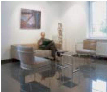
avec filtre de conversion KB12