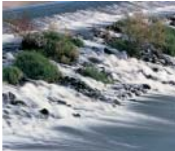
avec filtre gris 106

Les filtres correcteurs de lumière permettent de fines corrections de couleur, les filtres désignés color correction sont utilisés pour des interventions minimales ou sérieuses dans le rendu chromatique d'un film, pouvant même aller jusqu'à des effets calculés de dépaysement. Parfois c'est uniquement la sensibilité du film qui est un peu trop élevée pour faire apparaître des effets de mouvement ou pour une faible profondeur de champ avec un diaphragme le plus ouvert possible. Les filtres gris et neutre B+W de force variée permettent de pallier à ces situations.