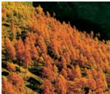
Filtre infrarouge B+W